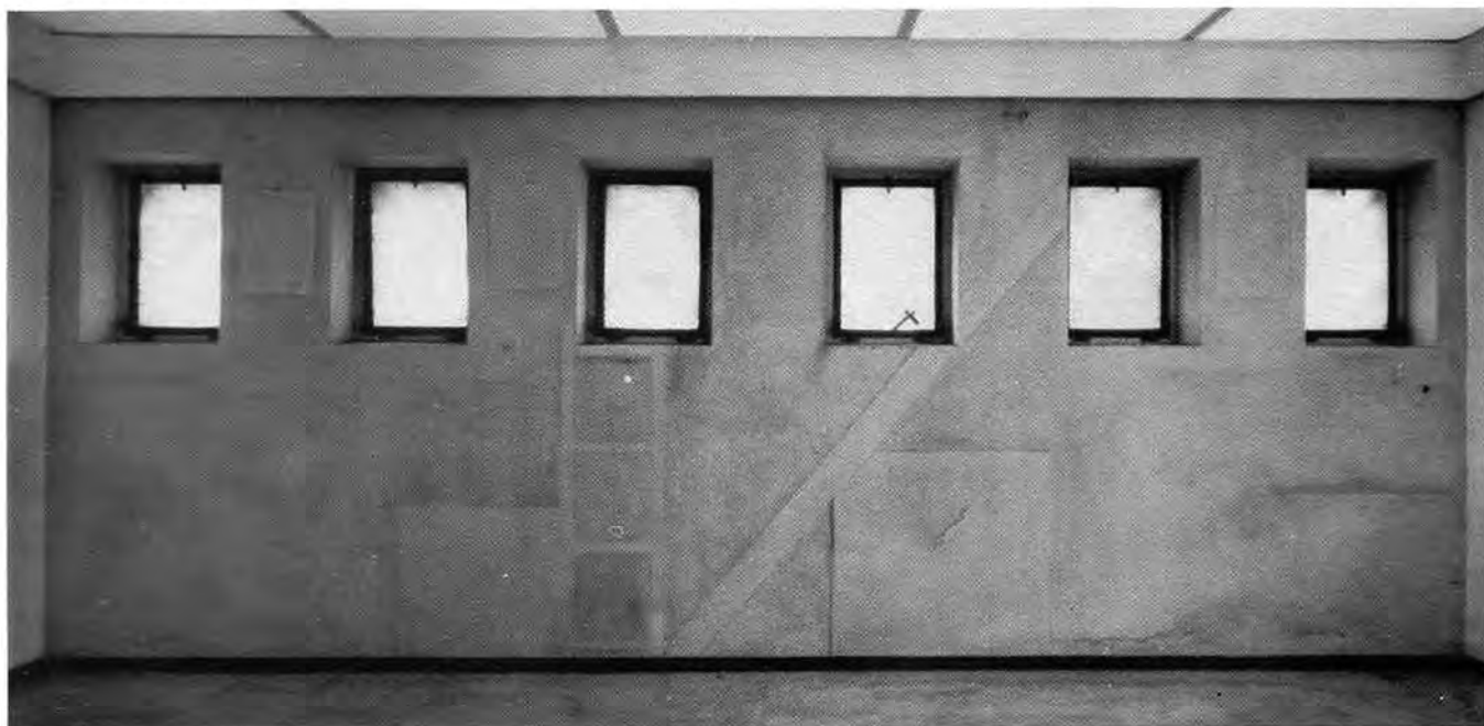
(b) delocazione 15.12.70